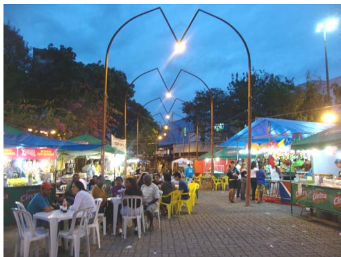
Figura 10: Ocupação do Largo da Penha pela Festa

A oposição que ganha relevo, no caso da Festa da Penha, não é tanto o público x privado, mas sim a relação sagrado x profano. Esta dualidade é a que sugere demarcar o espaço, polarizando os domínios entre o “em cima” e o “embaixo”. No entanto, a festa deve ser entendida de forma mais complexa, como uma resultante da interação de diversas interpretações sobre essa relação, postas em contato durante a intervenção. Segundo Menezes (1996), não se vê